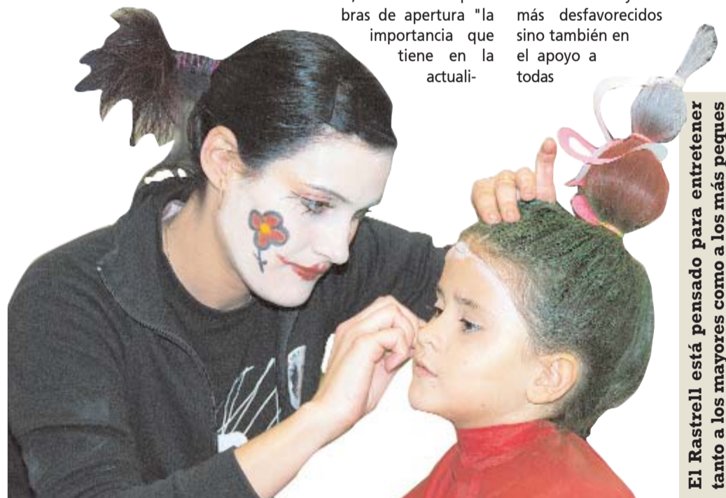
El Rastrell está pensado para entretener tanto a los mayores como a los más pequeños

En esta edición, fueron más de 25 asociaciones las que participaron, aportando su grano de arena a la labor de sensibilización social con la infancia, verdadero futuro de nuestra sociedad. A lo largo de estos dos días de Rastrell, numerosos fueron los alborayenses que se acercaron hasta la Ciutat de l'Esport para participar en la fiesta de la solidaridad adquiriendo productos en las asociaciones presentes, así como en la tómbola y en las actividades que el Ayuntamiento organizó. La recaudación del Rastrell junto a la obtenida a través de las otras actividades navideñas desarrolladas durante esos días, conforma la dotación económica de los galardones que libraré el Ayuntamiento dentro de su campaña "Enganxa't a la Solidaritat".