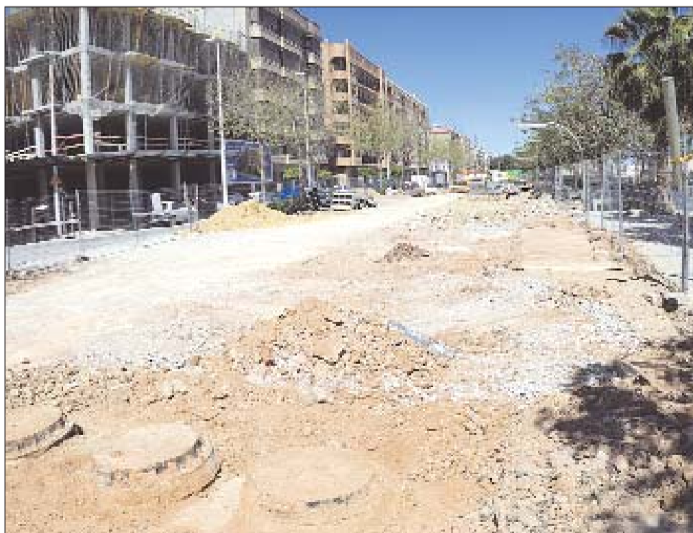
Las dos nuevas estaciones de bombeo instaladas están compuestas por 3 bombas de 82 kilowatios.