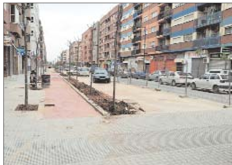
La reurbanización supone el aumento considerable del ancho de las aceras.