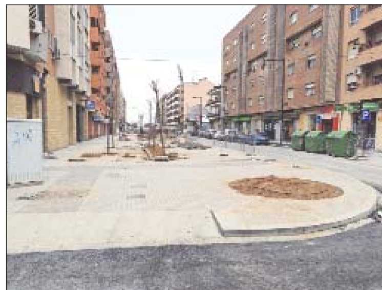
Cuando concluyan las obras se habrá eliminado todas las barreras arquitectónicas.