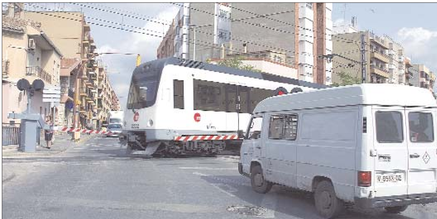
La peligrosa convivencia de las vías del metro con el tráfico y los peatones han motivado la decisión de enterrar las vías.

Con la consecución de este proyecto se satisfará una reivindicación histórica del municipio