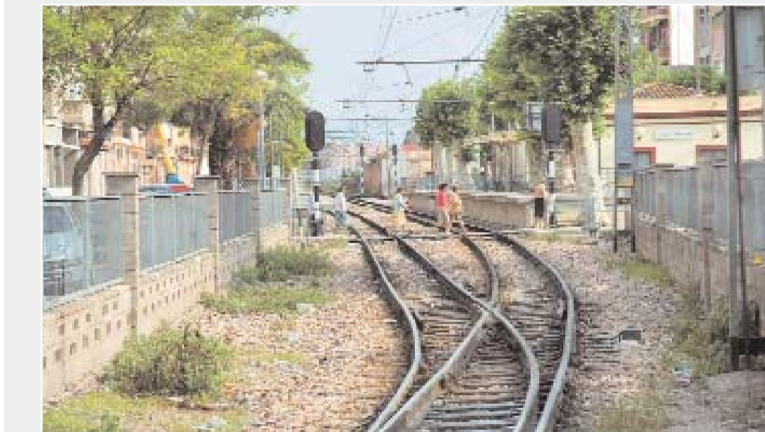
Estas imágenes no se repetirán cuando las vías del metro queden soterradas.