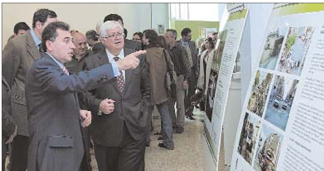
El proyecto puede contemplarse en la Casa de la Cultura.