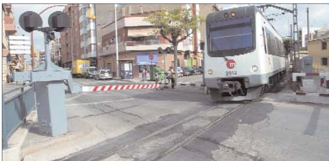
Las vías en superficie dividen el municipio en dos zonas, con los consiguientes problemas que se derivan de esta situación.

La inversión necesaria para acometer esta infraestructura es de 62,7 millones de euros y -