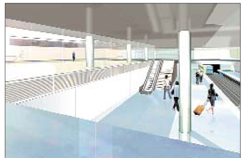
Las nuevas estaciones soterradas responderán al diseño más innovador.

público de Alboraya: el Parque de las Vías, con una longitud superior al medio kilómetro convirtiéndose -por su ubicación- en el nuevo pulmón de Alboraya. Este nuevo 'Parque de las Vías' se ha diseñado para el ocio, el deporte y la naturaleza y sin duda alguna será el nuevo punto de encuentro de mayores, jóvenes y pequeños en busca de esparcimiento al aire libre.